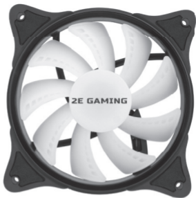
2E GAMING (2E-F120IR-ARGB)

Керівництво по використанню вентилятора для комп'ютерного корпусу